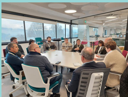
Εικόνα 1. Εργαστήριο στην Ισπανία